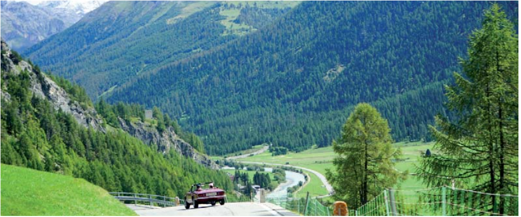
Aussicht ins Engadin bei La Punt