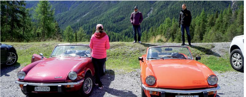
Halt im Schweizer Nationalpark