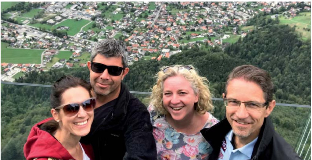
Dornbirn, vom 976 m hohen Karren aus. Herziges Städtchen mit einigen Sehenswürdigkeiten, darunter auch einem Rolls-Royce-Museum!