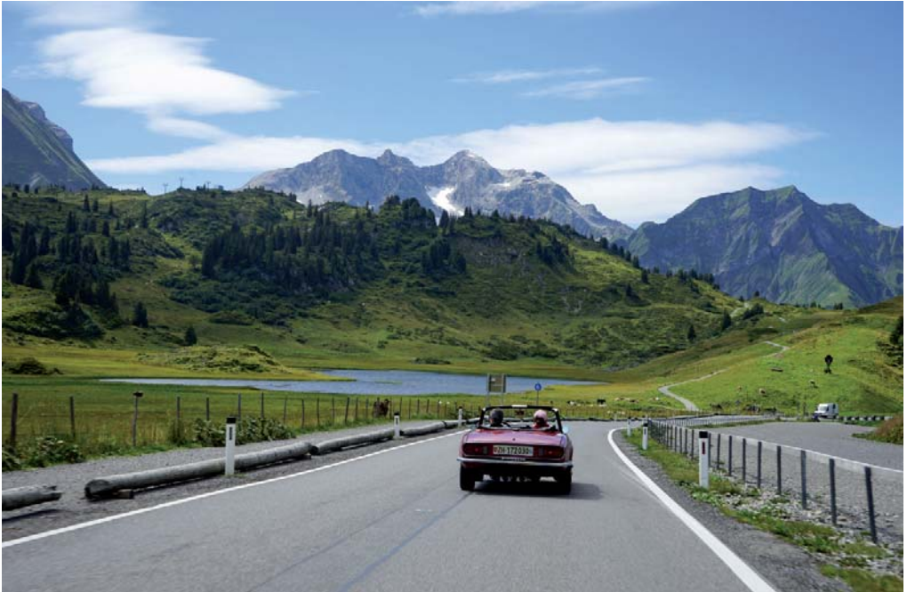
St. Anton und der Arlberg liegen jetzt hinter uns.