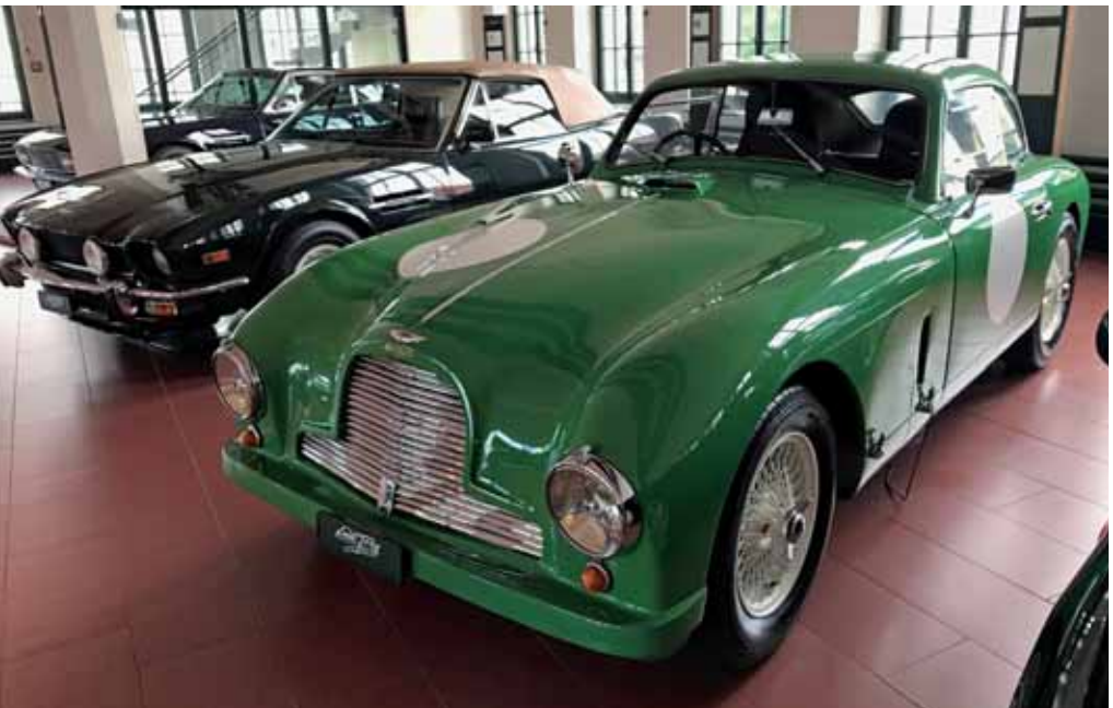
zwei Aston Martin