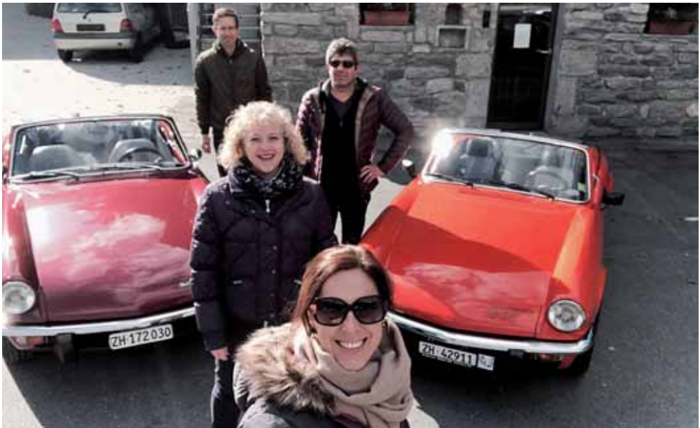
Wallis Übernachtung in Visp.