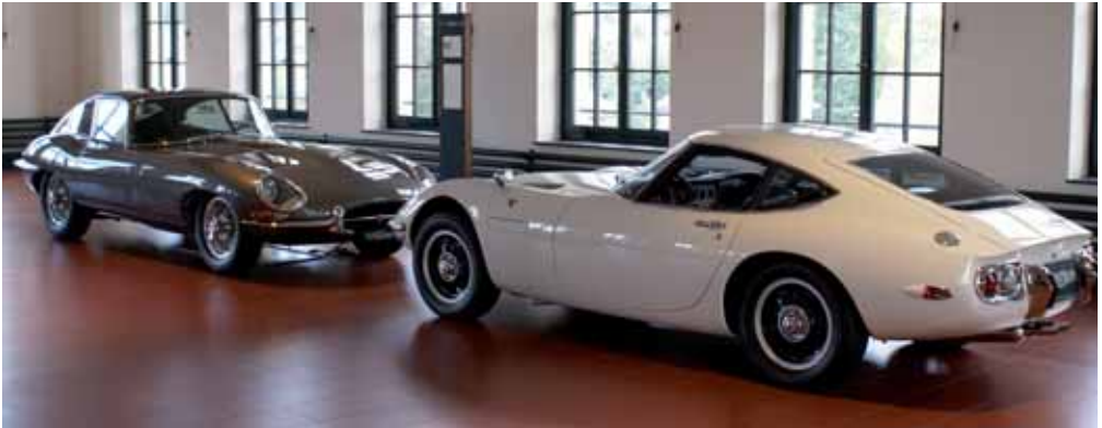
Jaguar F-Type und Toyota 2000

Als Exklusivvertreter von Toyota Automobilen begann Emil Frey 1967 mit dem Import der Fahrzeuge und der erste Corona 1500 steht heute auch im Museum, gleich neben einem seltenen Corona Pickup. Mein Favorit war der weisse, unverkäufliche (und sowieso unerschwingliche) Toyota 2000 GT mit dem Yamaha-Motor, eines von 351 gebauten Exemplaren, wovon aber nur etwa ein Dutzend überlebt haben sollen.