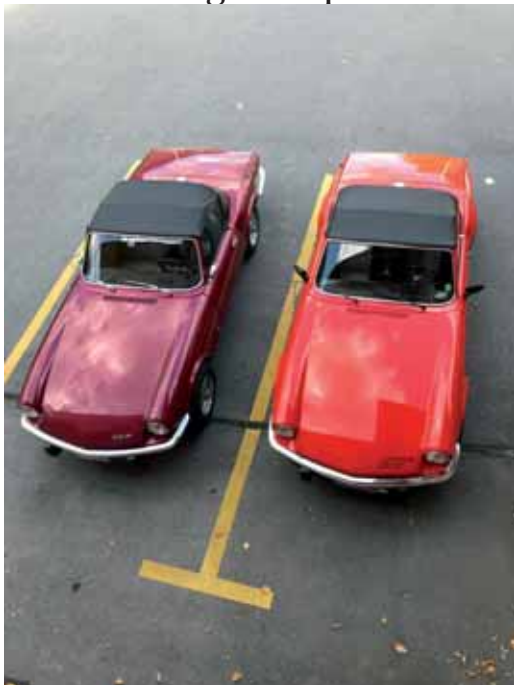
Wallis Zum Glück waren die Spidies zu zweit und nicht so alleine draussen die ganze Nacht.