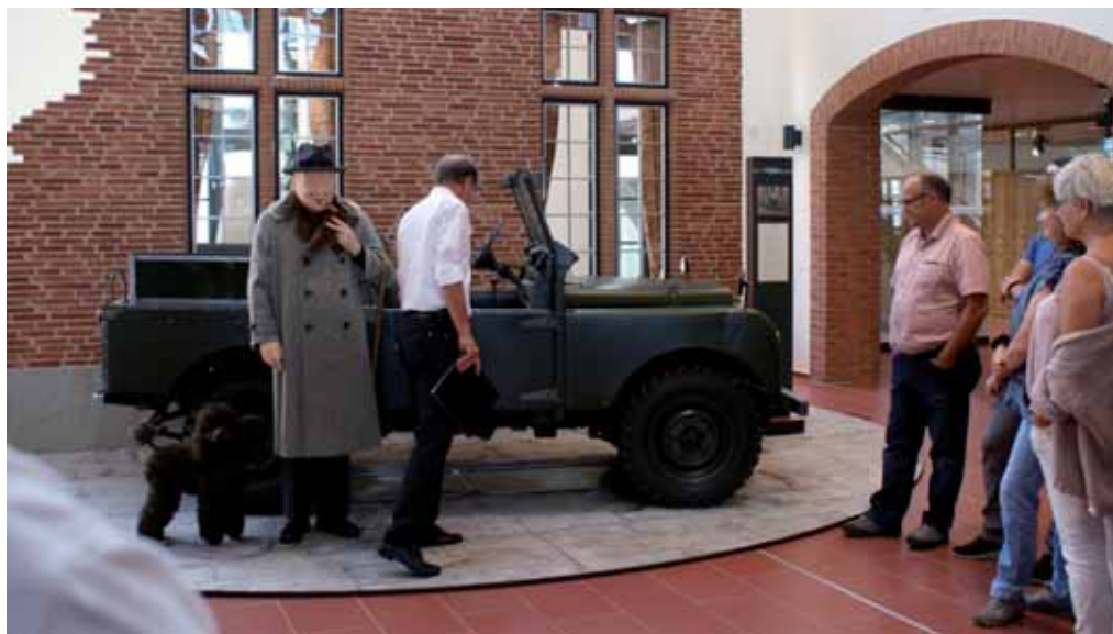
Churchills Land Rover

Für ein Lächeln in unseren Gesichtern sorgte auch der rote Subaru 1600 AWD von Bernhard Russi mit dem Nummernschild UR 5000, mit dem der ehemalige Skirennfahrer 1979 als Markenbotschafter für Subaru Werbung machte. Des Weiteren konnten wir englische Kostbarkeiten aus dem Hause Aston Martin und Jaguar bestaunen und am Eingang empfing uns Sir Winston Churchills Land Rover 86 mit der Beule im vorderen Kotflügel, entstanden weil man die Türe 180 Grad weit öffnen konnte.