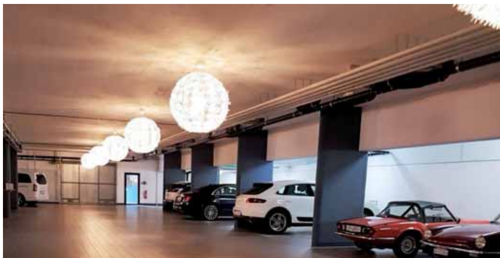
Locarno Auch die Spidis sollten es gemütlich haben. Tiefgarage mit Plättli am Boden und modernen Lampen von Ikea!