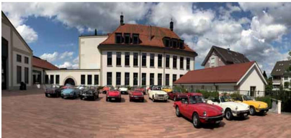
Autos vor dem Museum