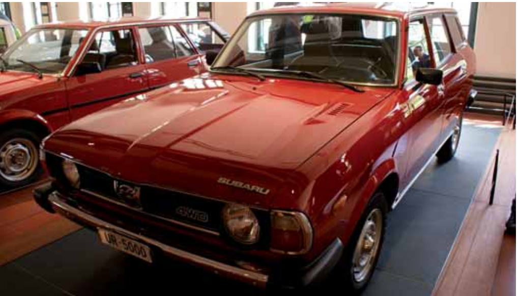
Subaru; Bernhard Russi

Als Exklusivvertreter von Toyota Automobilen begann Emil Frey 1967 mit dem Import der Fahrzeuge und der erste Corona 1500 steht heute auch im Museum, gleich neben einem seltenen Corona Pickup. Mein Favorit war der weisse, unverkäufliche (und sowieso unerschwingliche) Toyota 2000 GT mit dem Yamaha-Motor, eines von 351 gebauten Exemplaren, wovon aber nur etwa ein Dutzend überlebt haben sollen.