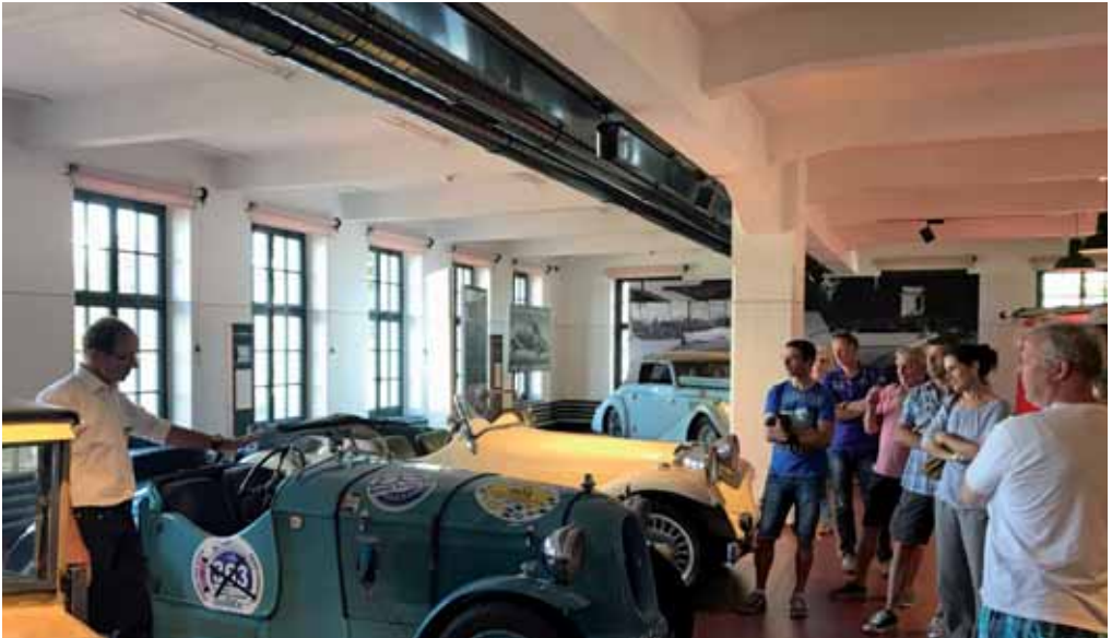
Jean führt durch die Ausstellung