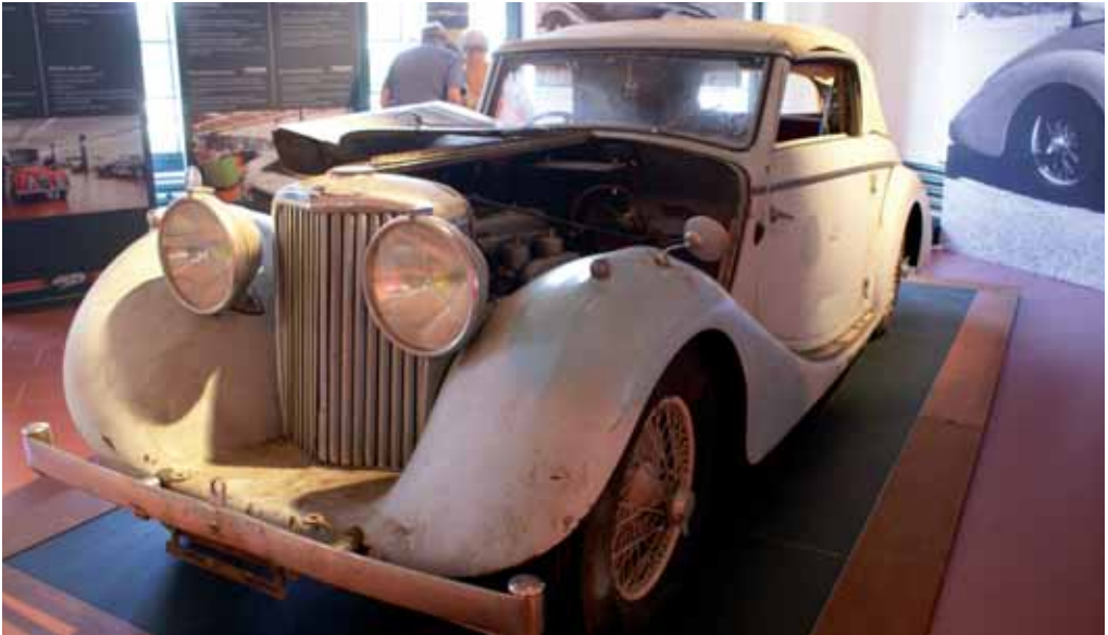
Jaguar im Originalzustand