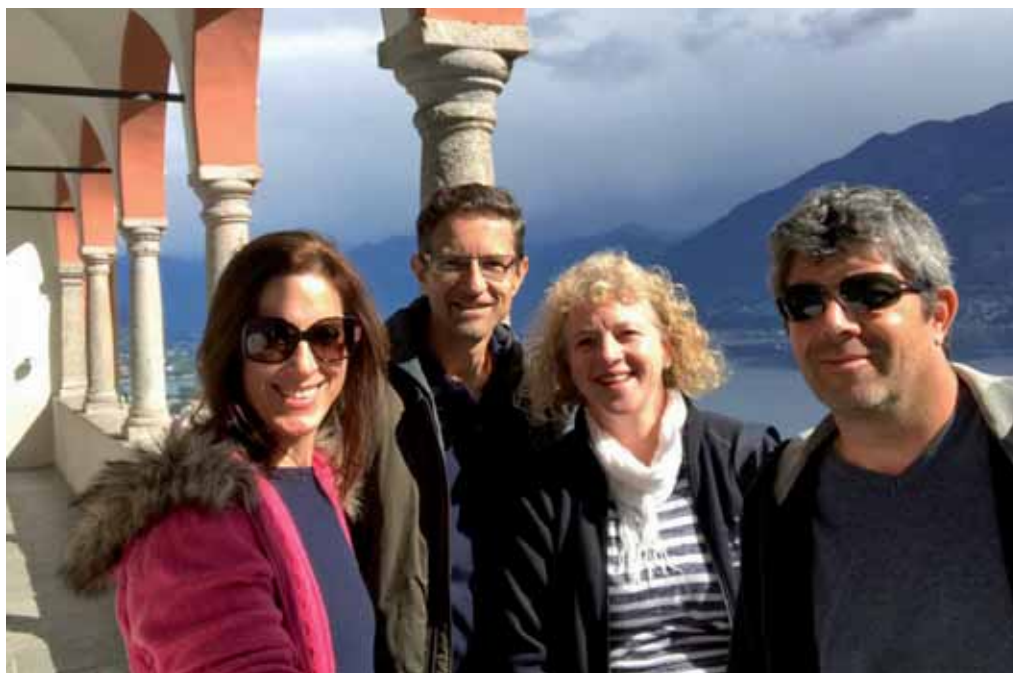
Locarno Die Crew.