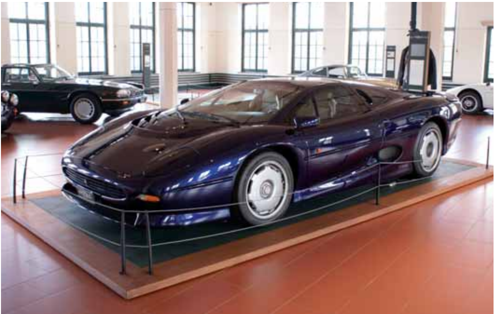
Jaguar XJ220, fast 5 Meter Länge bei nur 1,15 Meter Höhe